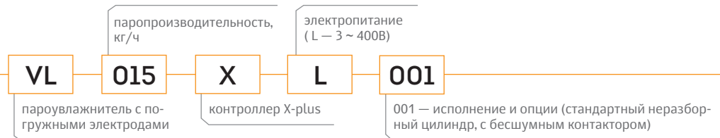
Быстрый подбор типоразмера